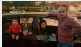
REUNITED Director: Mira Jargil