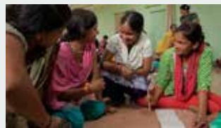
WRITING WITH FIRE Director: Rintu Thomas and Sushmit Ghosh