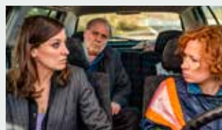
DAUGHTERS Director: Nana Neul