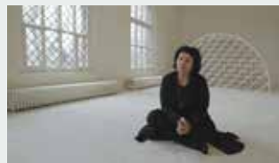
SEX, REVOLUTION AND ISLAM Director: Nefise Özkal Lorentzen