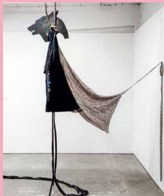
In the Stomach of the Predators © Alice Creischer