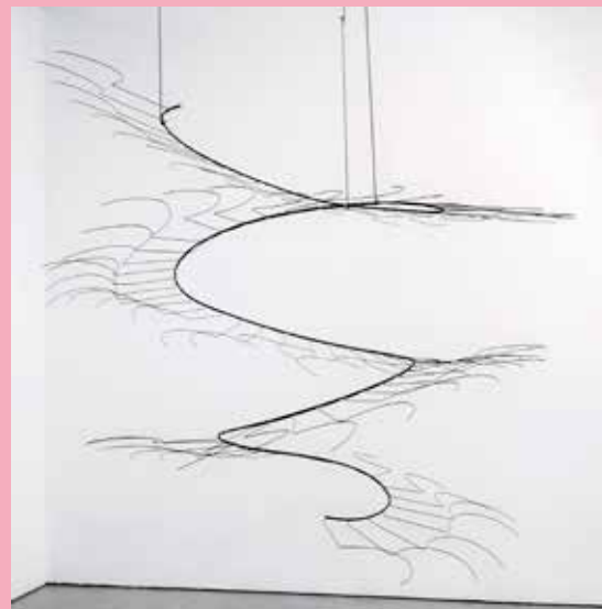
Vortex © Iza Tarasewicz

Given the speed of light in fiber it is possible to send an order from New York to Chicago and back in 12 milliseconds. It gives the occasion to be the first to exploit the discrepancies between prices in Chicago and prices in New York. A millisecond is a thousandth of a second A tenth of the time it takes you to blink your eyes, if you blink as fast as you can. [...]