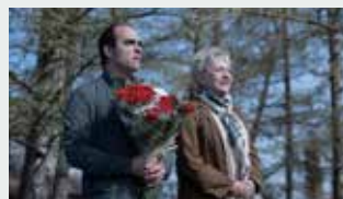
MAIXABEL Director: Iciar Bollain

20.30–22.10 Spelfilm YUNI , Panorama sal 2