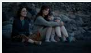
THE CONSEQUENCES Director: Claudia Pinto